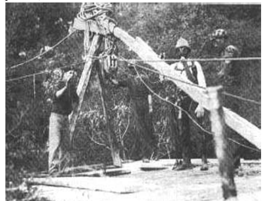
Una rara foto del recupero delle salme da una fojba

futura attività del Comitato provinciale sarà indirizzata sui temi storici per far conoscere con obiettività ad una più vasta schiera di studenti e cittadini gli eventi bellici, post-bellici, ma soprattutto i fattori internazionali che, via via, hanno condotto alla definizione dei nostri confini orientali sino al trattato di Osimo. Questa opera di conoscenza verrà affiancata con temi culturali, dall'archeologia classica, che tante vestigia ha lasciato in Istria e Dalmazia, all'architettura, alla poesia, alla letteratura.