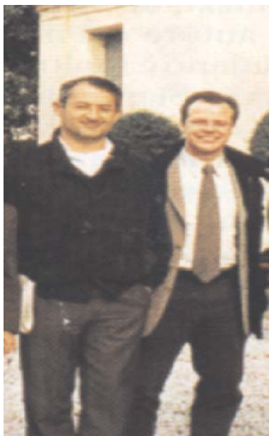
Valigie di cartone Articolo a pagina 8