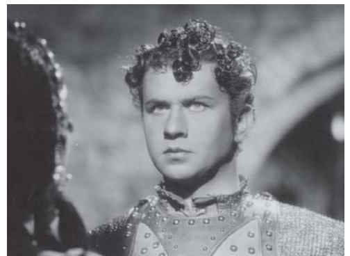
Nella foto, Gino Cervi interpreta "Ettore Fieramosca"

occasione per tanti altri di poter rivedere un film interessante. L'iniziativa è svolta in collaborazione con il Cineclub Verona e curata da Ugo Brusaporco. (da Cronaca)