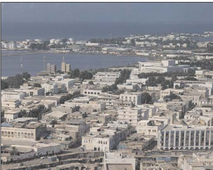
Una foto panoramica di Gibuti

libri del nostro ex impero, e a corroborare questa bellissima iniziativa dell'Assessorato alle Politiche Giovanili, vi saranno anche degli interventi, delle conferenze e video. Questa mostra, segue quella organizzata sempre dallo stesso assessorato, sui bombardamenti di Verona, di cui abbiamo parlato ampiamente nei nostri precedenti numeri, e che ha avuto un grandissimo successo sia per la presenza