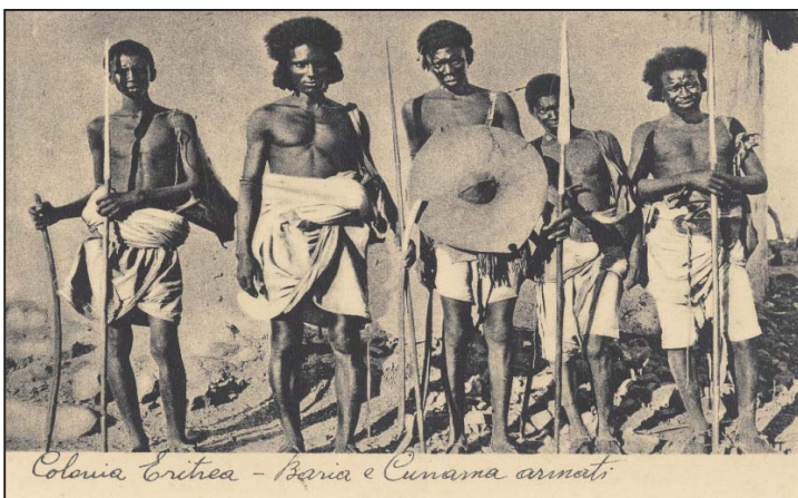
Colonia Eritrea - Barca e Cusama armati