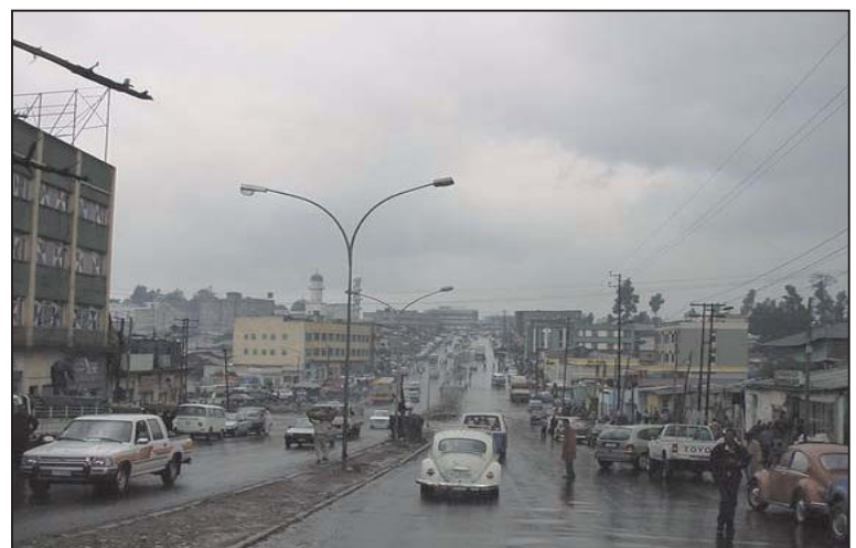
Panoramica di Churchill Road, Addis Abeba