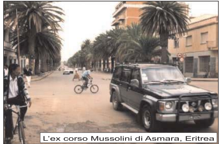
L'ex corso Mussolini di Asmara, Eritrea

aprirà nella città scaligera un'interessantissima mostra sugli stati del cosiddetto Corno d'Africa, che comprende il territorio di Afar e dell'Isas, ora Gibuti, l'ex colonia italiana dell'Eritrea con capitale Asmara, recentemente divenuta indipendente, l'Etiopia, con capitale Addis Abeba, ed infine la Somalia. Verranno esposti quadri, fotografie, cimeli,