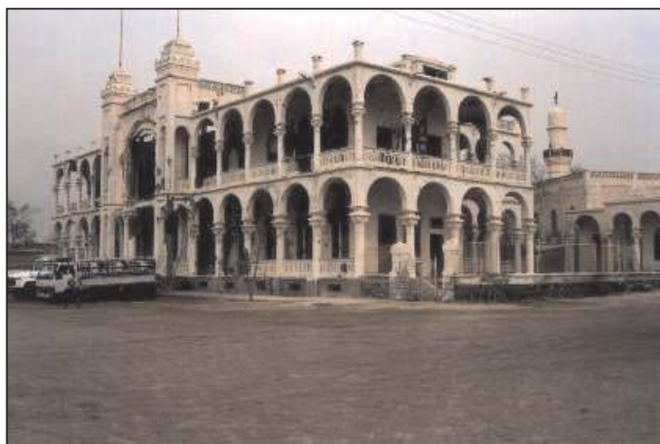
Il famoso palazzo di Massaua, in Eritrea

scaligera, sia dagli anziani che hanno voluto rivivere attraverso questa mostra i tragici avvenimenti dei bombardamenti "alleati".