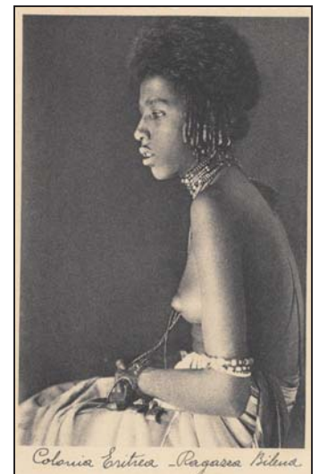
Colonia Eritrea - Ragazza Bilua