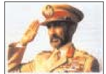
Il Negus Haile Selassie

delle scolaresche che non sapevano assolutamente niente di questi terribili giorni sofferti dalla città'